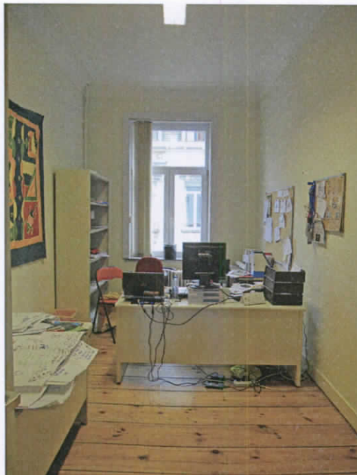
2ème étage avant