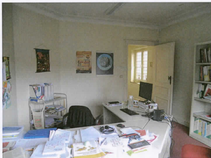
entre sol 1er étage