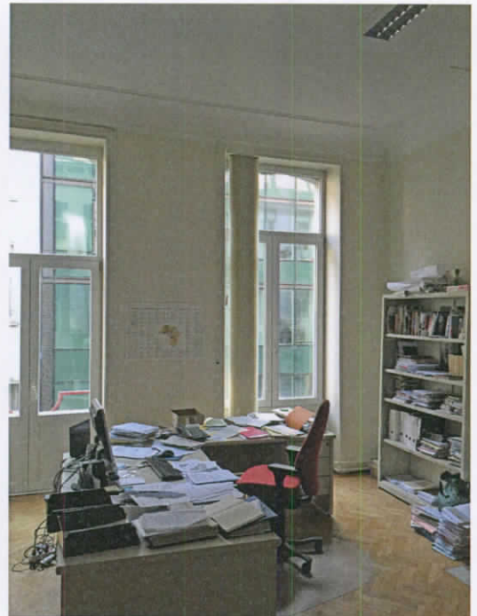
1er étage avant