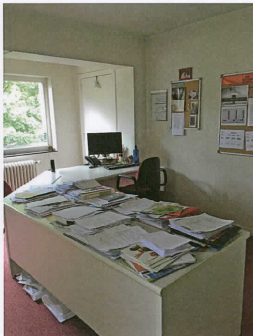
entre sol 2ème étage