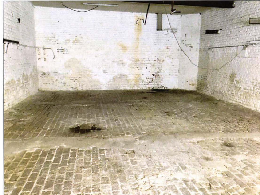
VUE SUR MUR MITOYEN ARRIERE RDC