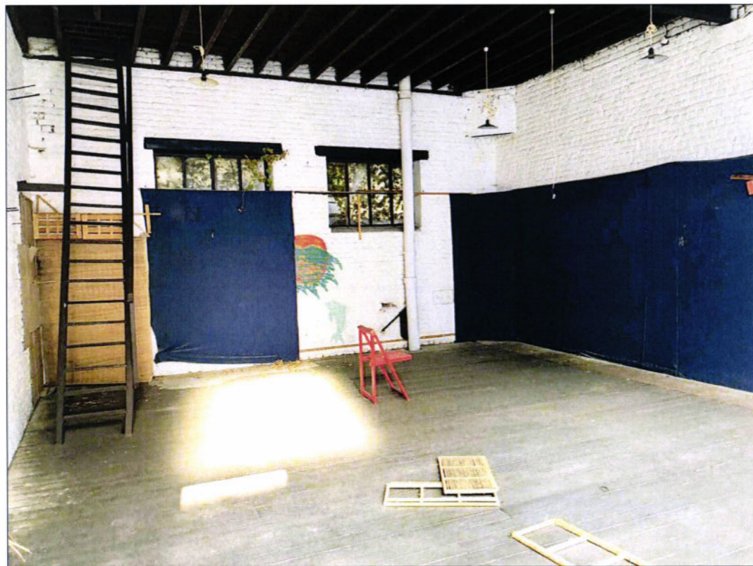
VUE SUR MUR MITOYEN ARRIERE R+1