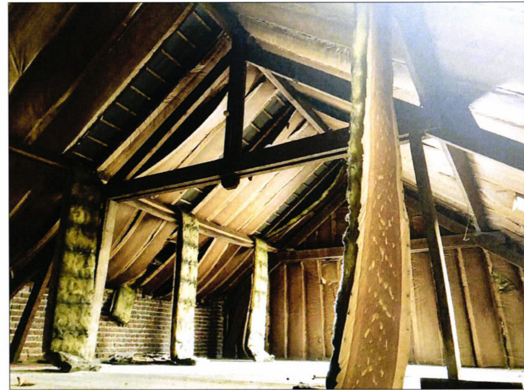
VUE ETAGE SOUS TOITURE