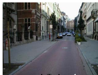
rue de Toulouse 1