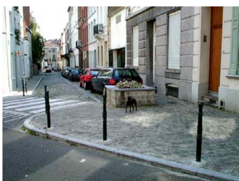
rue du Berceau