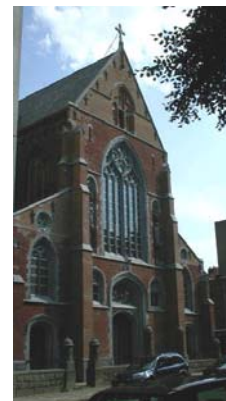
av. de la Renaissance