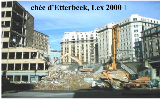
chée d'Etterbeek, Lex 2000 1