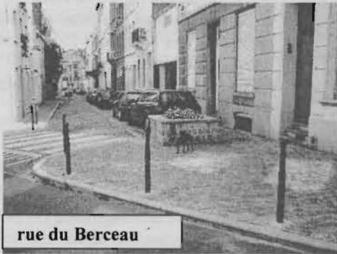
rue du Berceau