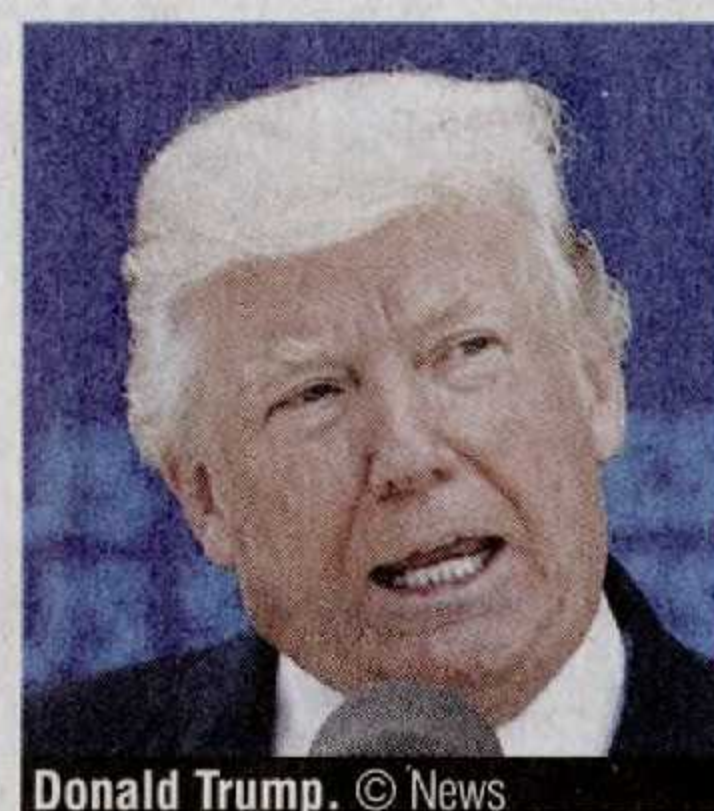
Donald Trump.

fasse dans un périmètre trop limité ou que la distribution ne soit pas complète. « Il faut au moins que l'information arrive d'ici deux semaines maximum pour que les gens partant en vacances soient prévenus. » ●