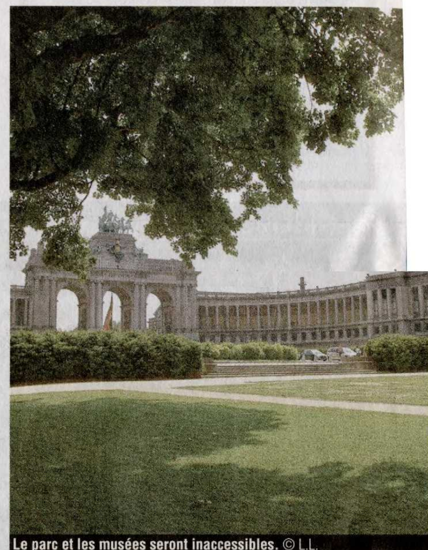
Le parc et les musées seront inaccessibles.