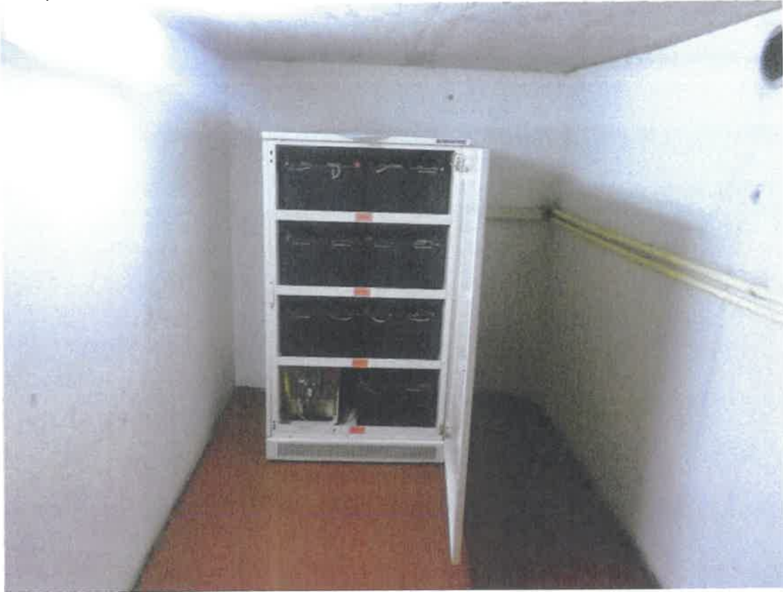
Rubrique 3 Batteries Stationnaires UPS2 B232 Photo 3