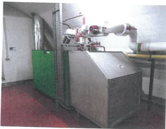
Rubrique 40b Chaufferie CH1 photo 2 (Puissance 755KW)