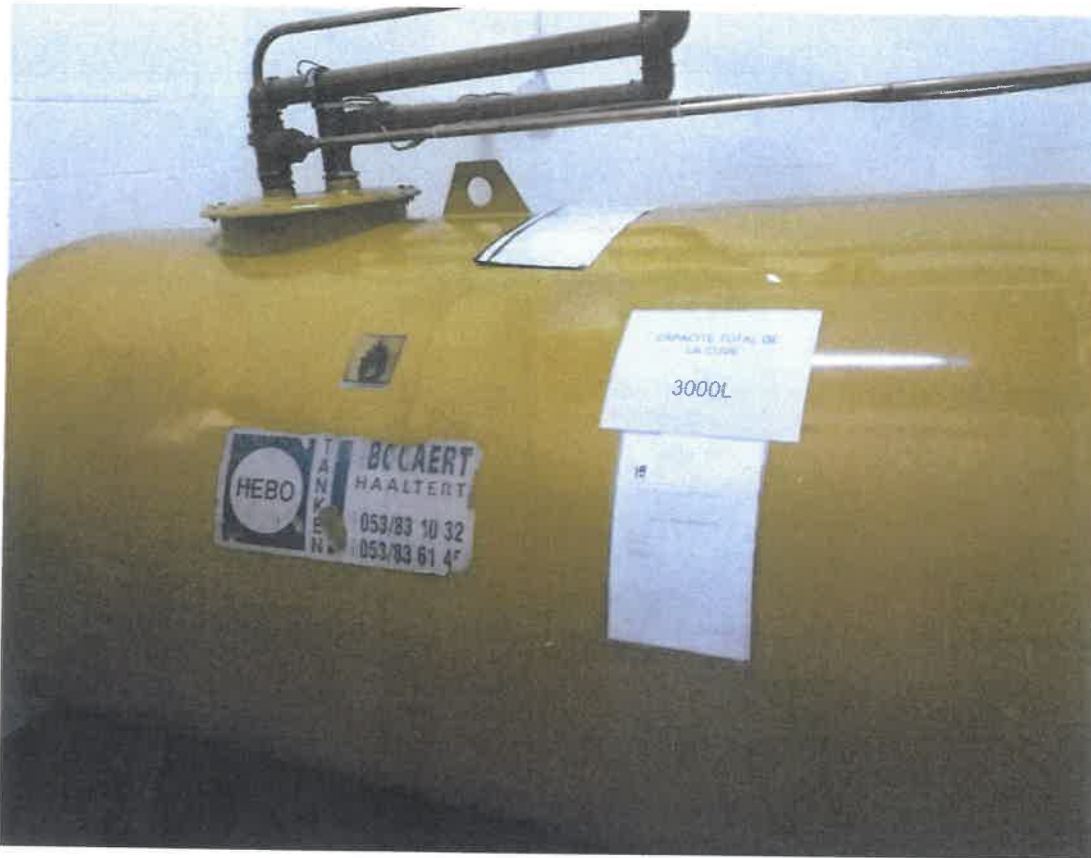
Rubrique 88.3a Citerne a fuel photo 2 Epoxy flooring et bac de rétention