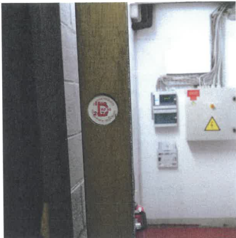
Rubrique 55a et 104a Groupe de secours photo 1