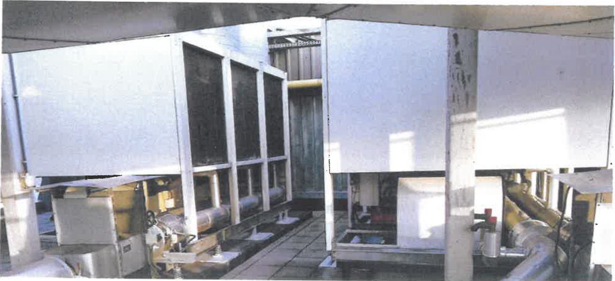
Rubrique 132b Installation de froid photo 3