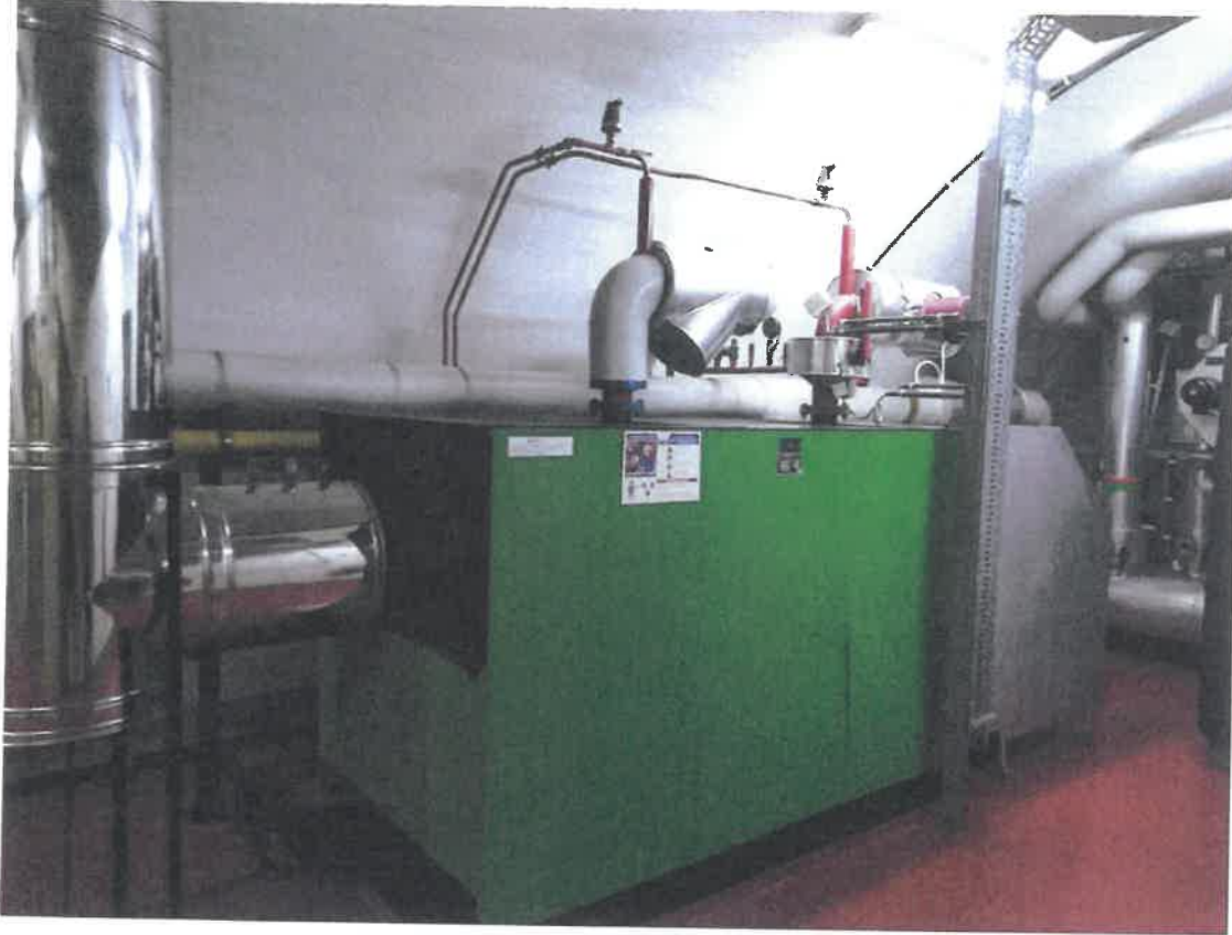
Rubrique 40b Chaufferie CH2 photo 2 (Puissance 755KW)