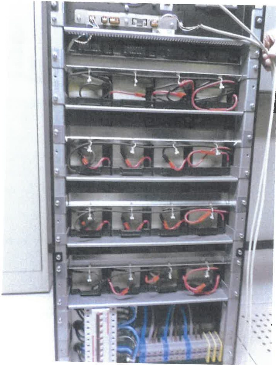
Rubrique 40b Chaufferie CH1 photo 1