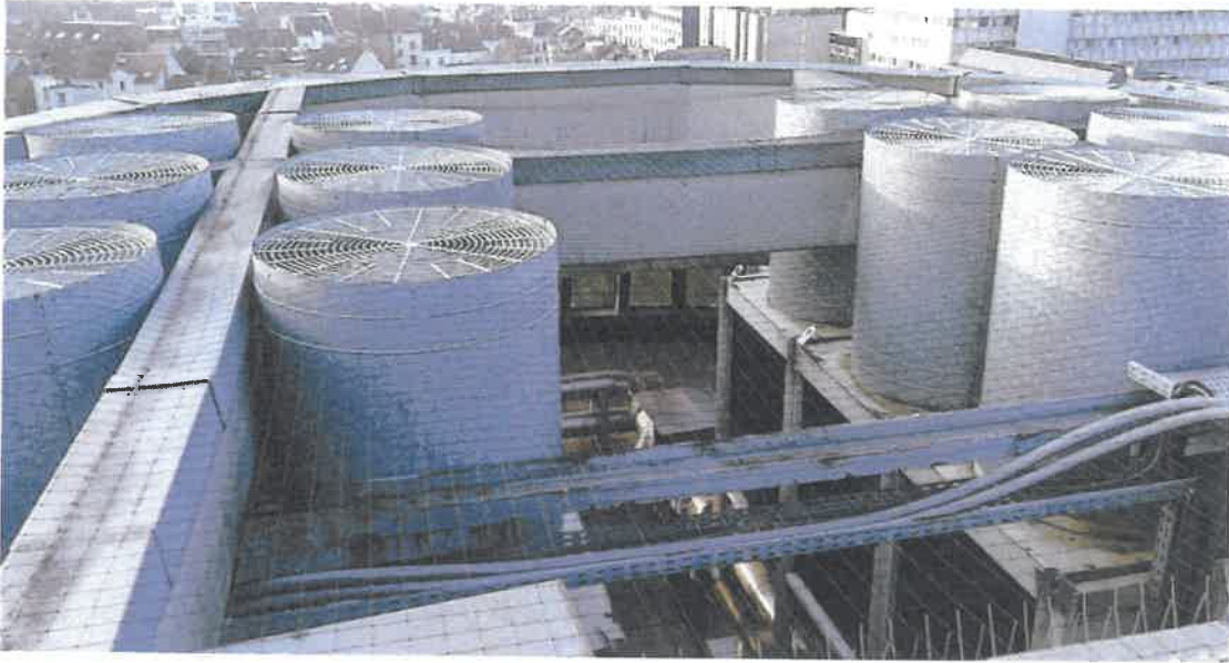
Rubrique 132b Installation de froid photo 2