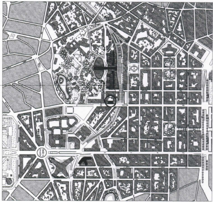
SITUATION : 1/5.000