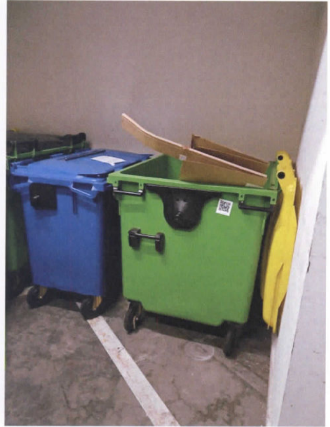
E) Tri de déchets : local poubelle