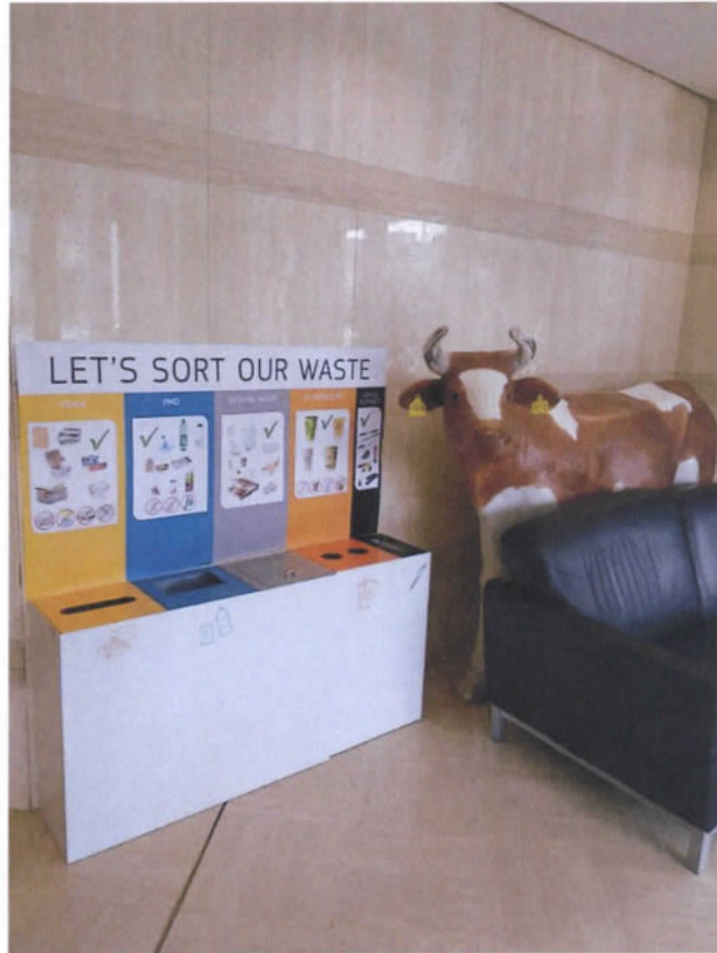
A) Ilot de tri à la réception