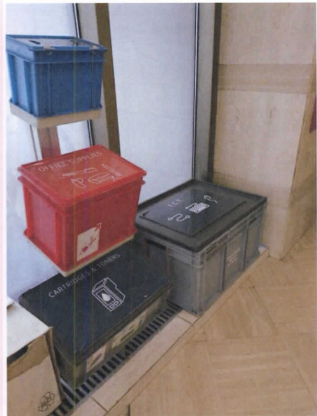
C) Tri de déchets spéciaux (halle entrée)