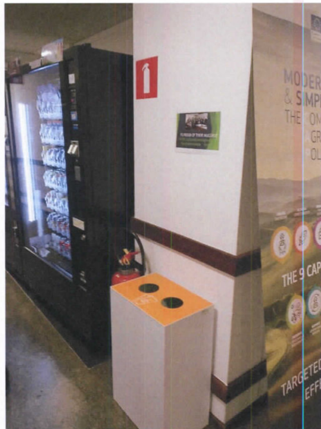
D) tri des gobelets à la cafeteria