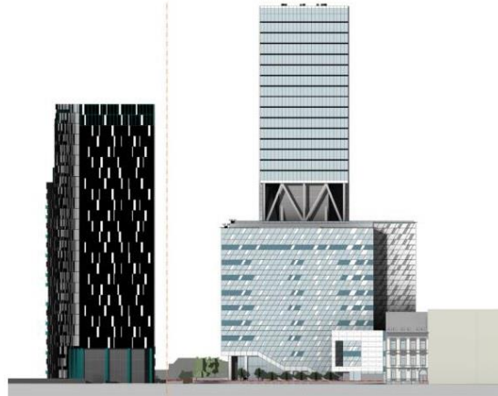
Vue en façade nord. A gauche, la tour The One déjà construite.

Sous enquête publique jusqu'au 5 novembre 2020, le projet REALEX vise à construire un important complexe rue de la Loi, aux numéros 91 à 105. Vraisemblablement pour les institutions européennes, il accueillera un centre de conférences et 33 étages de bureaux, poursuivant ainsi cette logique portée par la région bruxelloise d'un sombre corridor de tours pour la rue de la Loi. Aussi, il contiendra un parking de 266 places alors que notre quartier est déjà saturé de voitures !